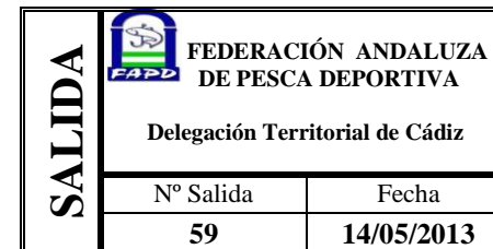
Fdo. Pilar Collantes Anelo